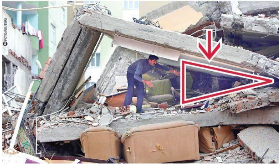
Un supraviețuitor al cutremurului care a distrus orașul Van din Turcia în octombrie 2011, alături de un „triunghi al vieții”

Oamenii din interiorul vehiculelor sunt zdrobiți când șoseaua de deasupra cade peste mașinile în care aceștia se află. Supraviețuirea este mai sigură dacă ieșiți afară și vă întindeți lângă autovehicul. Mașinile zdrobite au goluri de aproximativ 1,5 m lângă ele.